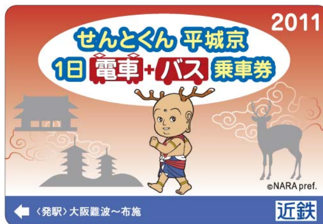
カード乗車券（大阪難波～布施発のもの）