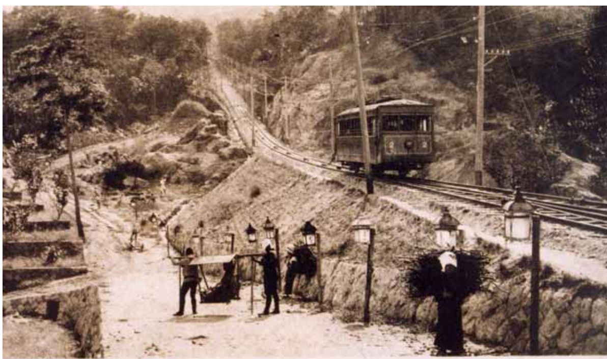
開業当時の生駒ケーブル(1918年)

発駅+++【集合 10:00】生駒駅・・・鳥居前駅===宝山寺駅(運転台・巻上げ所見学)=== 鳥居前駅・・・【昼食】味楽座生駒店(11:10 ~ 11:50 頃)・・・生駒駅+++石切駅・・・旧生駒トンネル見学(入口より 330m 付近折り返し)・・・石切駅【解散 13:30 頃】+++発駅