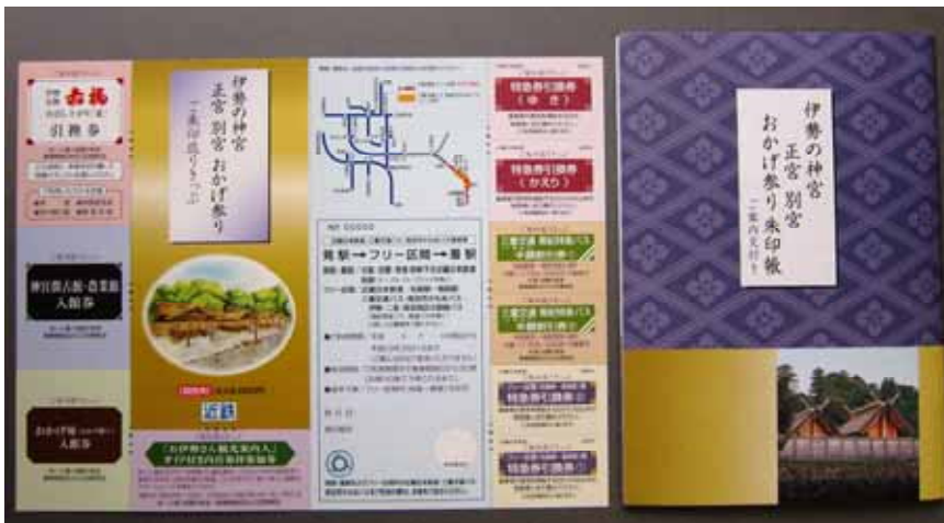
「伊勢の神宮 正宮 別宮 おかげ参り ご朱印巡りきっぷ」