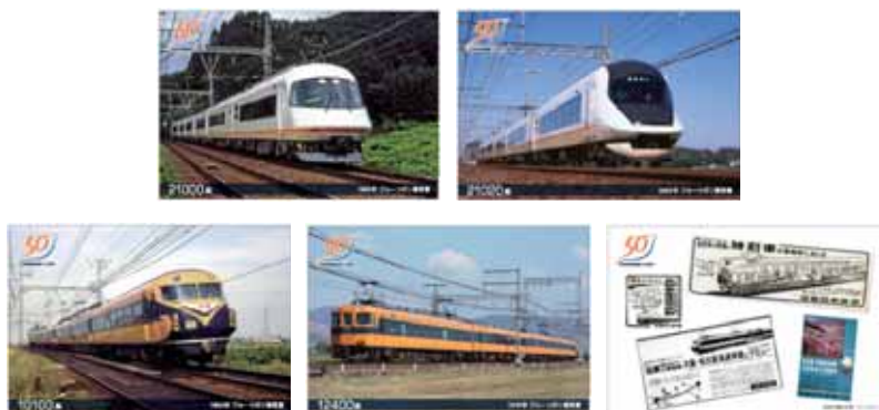
[ポストカード5種類]