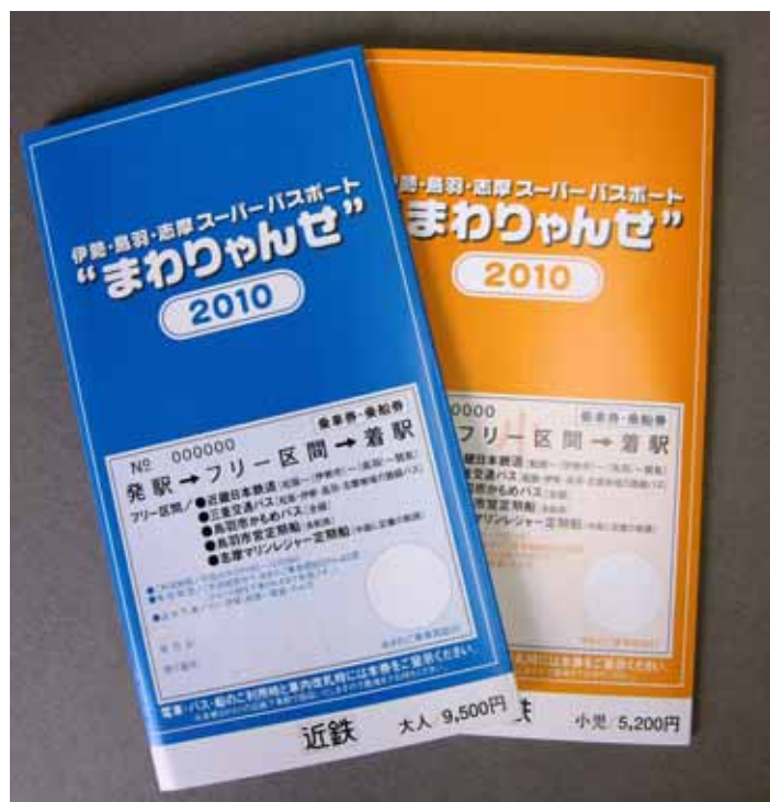
「伊勢・鳥羽・志摩スーパーパスポート“まわりゃんせ”」

新たな特典も加わってさらに便利になった、近鉄のお得なきっぷ“まわりゃんせ”で、魅力いっぱいの伊勢・鳥羽・志摩へぜひお出かけいただければと考えています。詳細は別紙のとおりです。