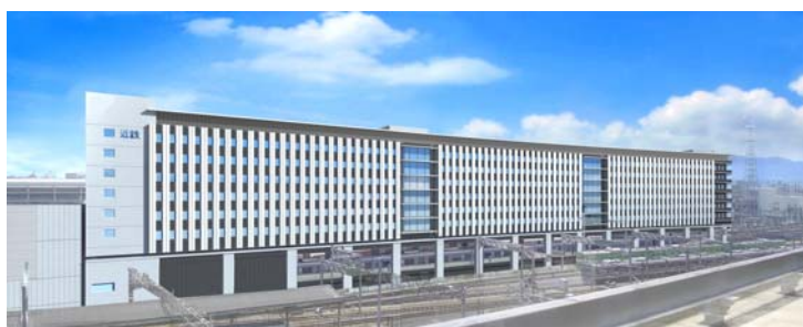
「ホテル近鉄京都駅」完成後イメージパース（北面より）