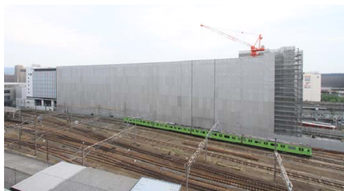
「ホテル近鉄京都駅」建設中写真（北面より） （平成23年5月9日撮影）