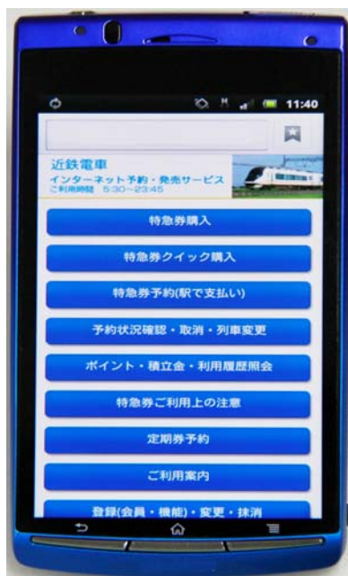
スマートフォン画面イメージ