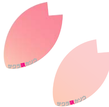
桜の花びらシール イメージ