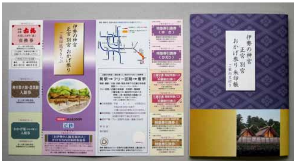
「伊勢の神宮 正宮 別宮 おかげ参り ご朱印巡りきっぷ」