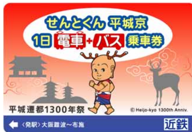
カード乗車券 (大阪難波～布施発のもの)