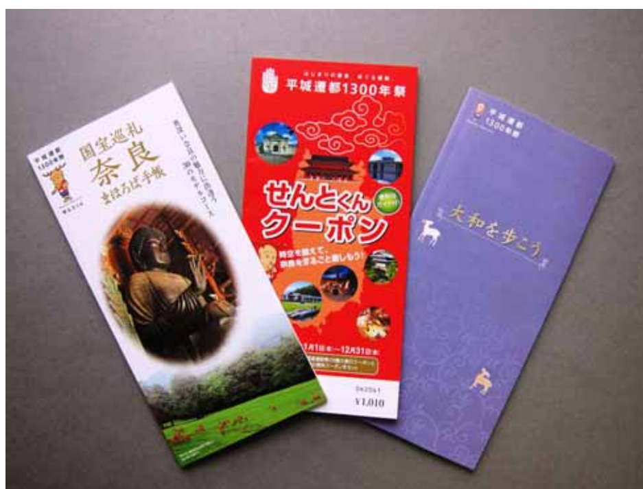
「国宝巡礼奈良まほろば手帳」・「せんとかんクーポン」・「大和を歩こう」