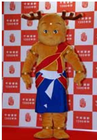
公式マスコットキャラクターせんとかん

日時 平成22年3月19日(金) 13時～17時(予定) 場所 地下改札口 コンコース