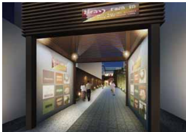
「な・ら・ら」入り口

平成20年4月2日(水) 正午(全14店舗のうち1店舗については4月末頃オープン予定)