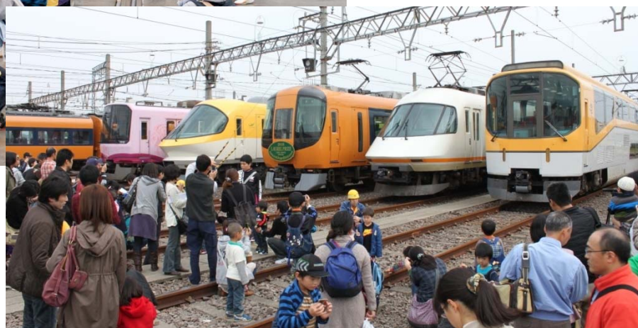
車両の展示（昨年の様子）