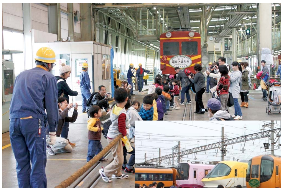
電車と綱引き（昨年の様子）