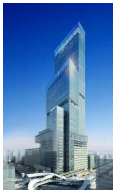
阿部野橋ターミナルビル（タワー館）イメージパース