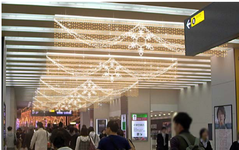
大阪阿部野橋駅西コンコースに設置するイルミネーション「光のバナー」（イメージ）