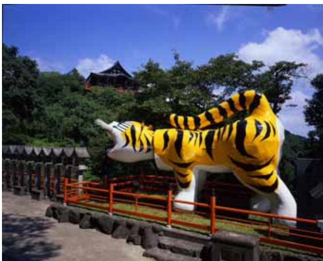
信貴山朝護孫子寺と張り子の虎

来年、平成22年は寅年であり、信貴山朝護孫子寺では、「平城遷都1300年祭」のオープニングイベントを皮切りに、12年に1度の特別行事が数多く行われます。ぜひこの機会に「信貴山寅年<福招き>きっぷ」とリニューアルされた西信貴ケーブルをご利用いただき、信貴山朝護孫子寺にご参拝いただければと考えています。