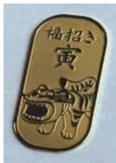
「信貴山寅年<福招き>小判」