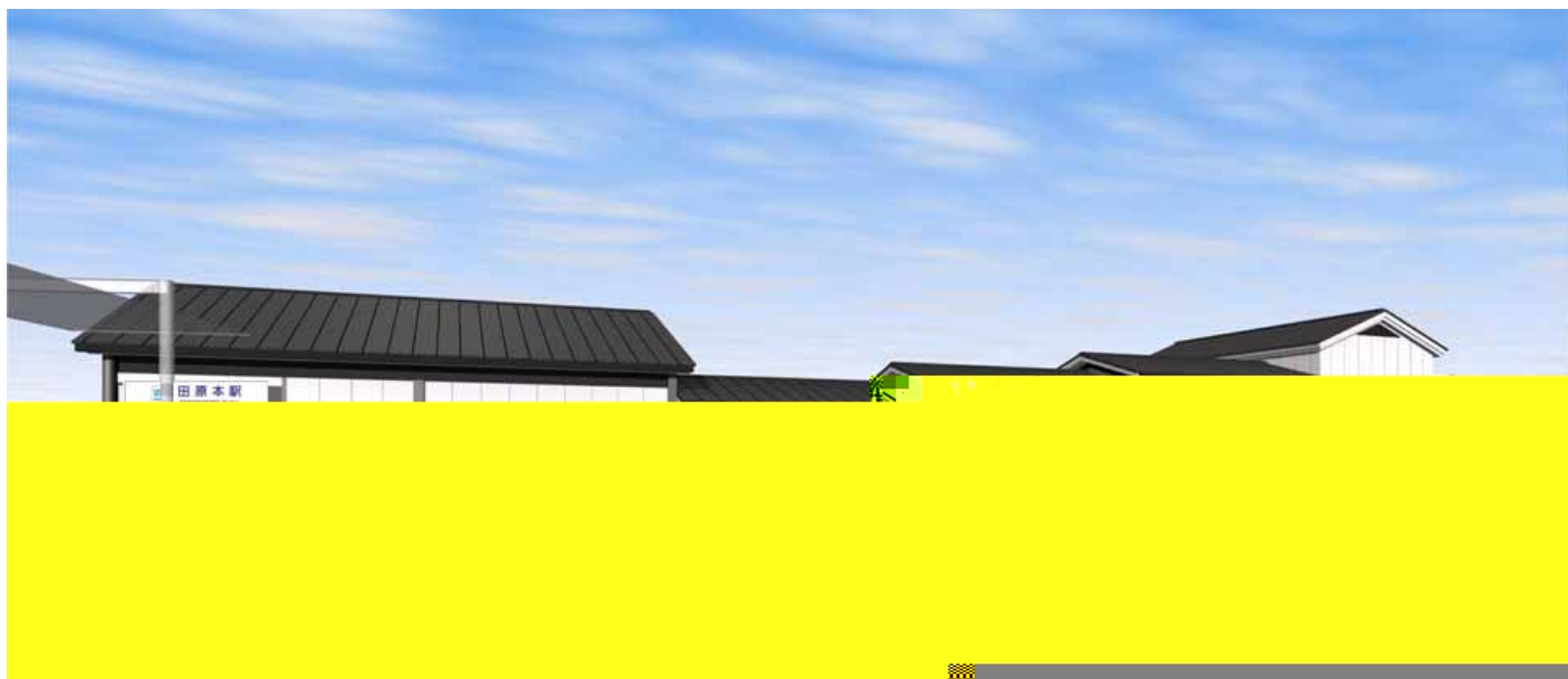
田原本駅 西駅舎完成イメージ