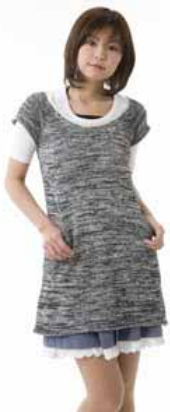
「ローリーズファーム」

最新トレンドのアクセサリをメインに、幅広いジャンルのアクセサリやチャーム、時計、雑貨を取り揃えたショップ。