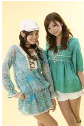
「ワンウェイ/バイバイ」