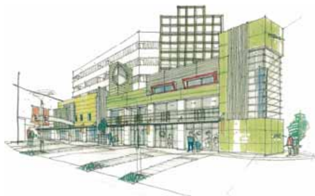
リニューアル後「ふれあいモール」イメージ

なお、これまでは飲食店中心のテナント構成であったため、この飲食店モールを「グルメパーク」と呼んでおりましたが、今回のリニューアルにより物販テナント中心のゾーンに生まれ変わりますので、これを機に遊歩道部分と店舗部分を総称して「ふれあいモール」と改称いたします。