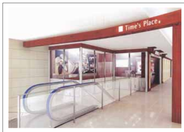
「Time's Place」近鉄難波駅東口付近