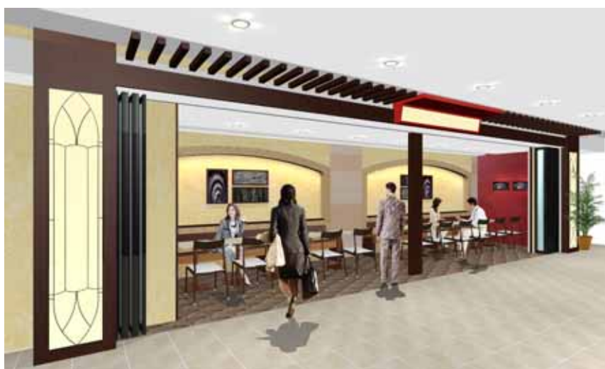
「Time's Place」共用お客様スペース

「Time's Place」では、お客様が気軽におくつろぎいただける共用のお客様スペースを2箇所(合計約60㎡、約50席)ご用意しています。