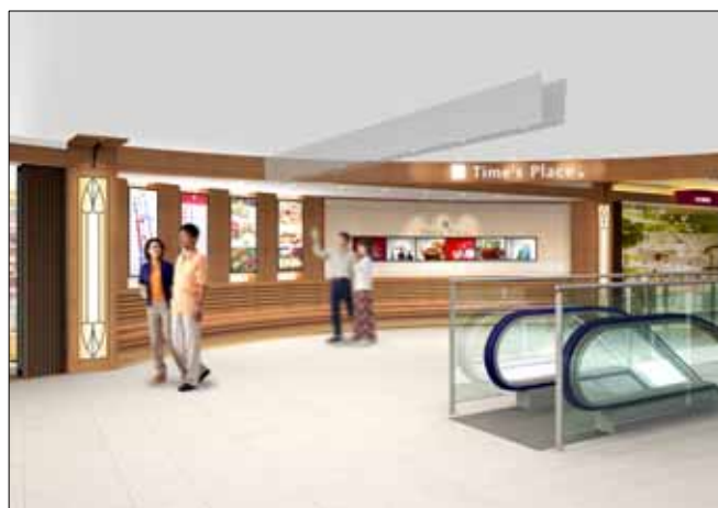
「Time's Place」近鉄難波駅西口付近

第3期(2店舗):平成21年2月頃オープン予定(第3期でショッピングモール完成)