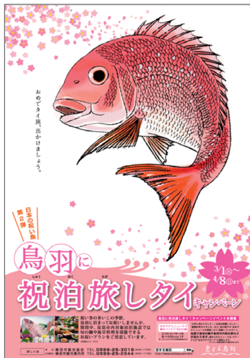
キャンペーンポスター

慶事が多いこの時期に鳥羽への祝泊旅キャンペーンを実施します。期間中、鳥羽市内宿泊施設各所では、“鯛”、“真珠の海七草”を用いた料理を含む宿泊プランの特別割引、通常の宿泊プランに鯛料理追加などのサービス、祝い膳などの祝泊旅プランをご用意しております。また3月の毎日曜日（4日、11日、18日、25日）には、鳥羽駅1階送迎バス乗り場で“鯛”、“真珠の海七草”を使った料理のふるまいなどのおもてなしイベント（10時～12時、なくなり次第終了）も実施予定です。