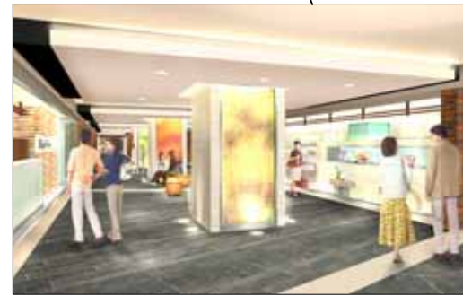
物販・サービスゾーンイメージパース