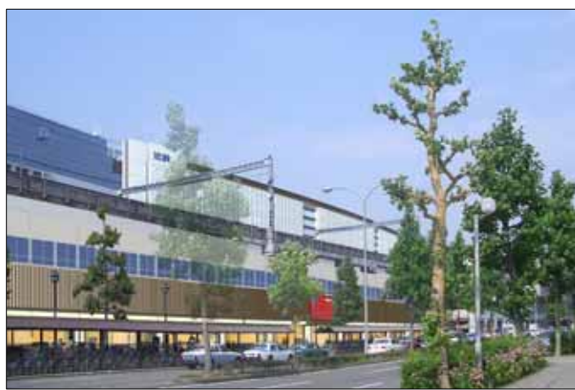
近鉄名店街みやこみち 南側外観イメージパース