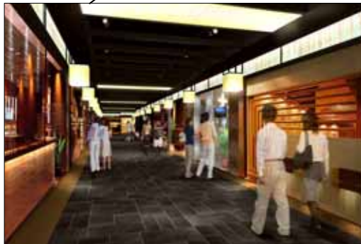
飲食ゾーン（西側部分）イメージパース