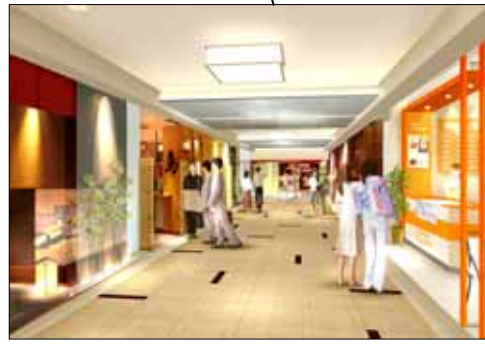
飲食ゾーン（中央部分）イメージパース