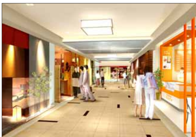
飲食ゾーン(中央部分) イメージパース