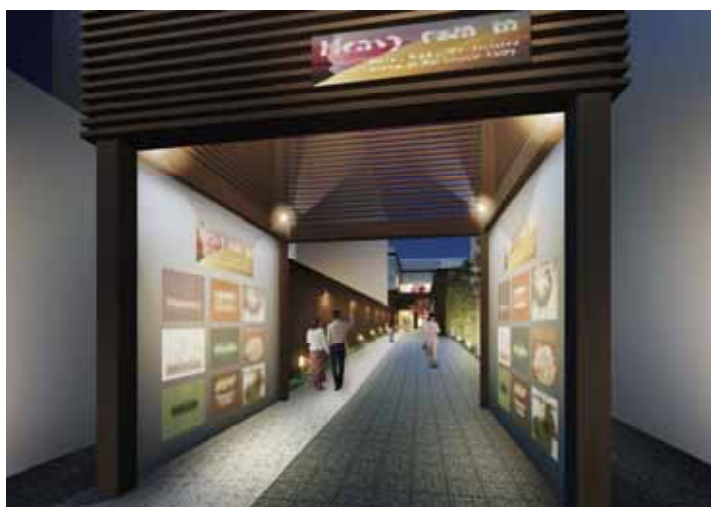
新商業施設への誘導通路

近鉄では、この新商業施設が地元の方々をはじめ多くのお客様に親しまれることで、近鉄奈良駅周辺のさらなる賑わい創出につなげたいと考えています。