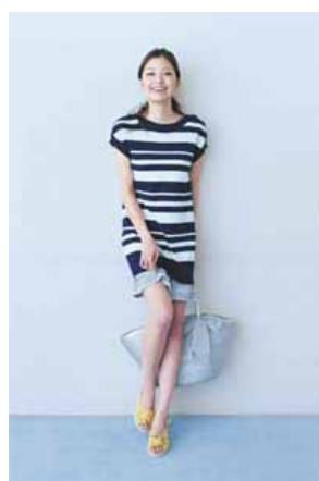
「アースミュージック&エコロジー」