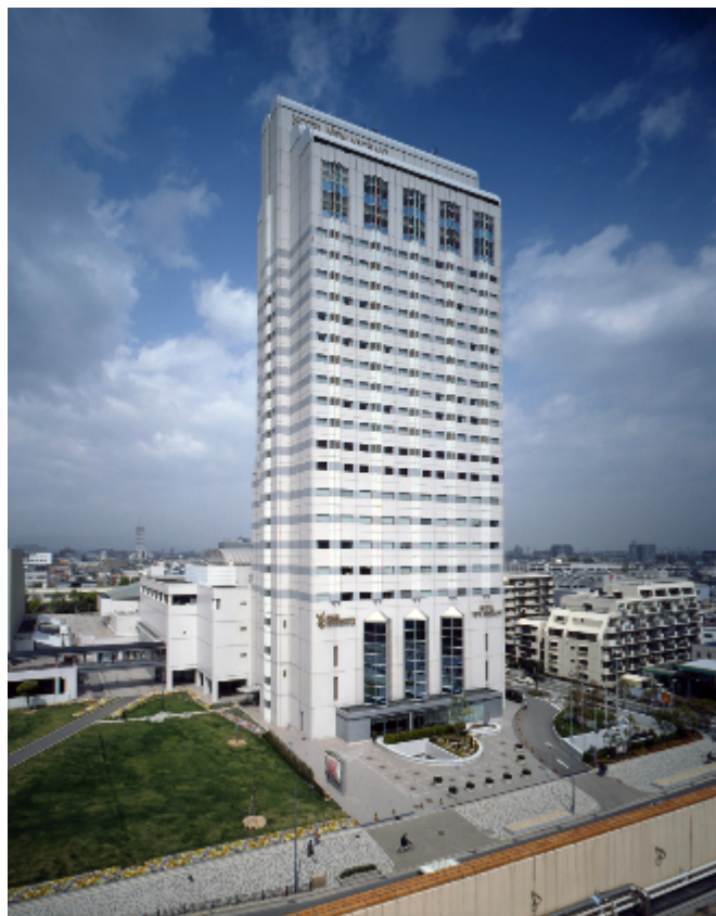
「ホテルニューアルカイク」外観

近鉄では、阪神尼崎駅近隣に立地する「ホテルニューアルカイク」につき、住友生命保険相互会社から同ホテルの建物を取得し、また株式会社ホテルニューアルカイクから同ホテルの事業を譲受することとして、本日三者で基本合意書を締結いたしましたので、お知らせいたします。