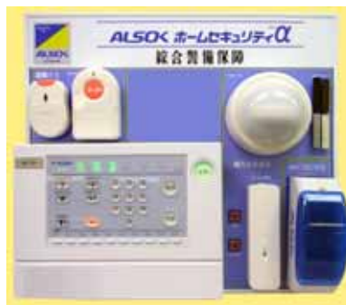
ALSOK ホームセキュリティ