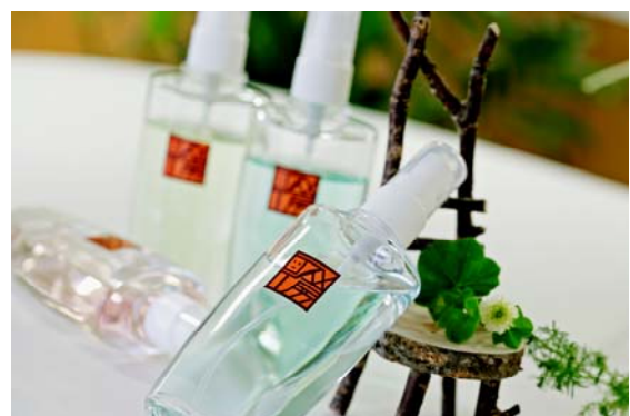
ルームフレグランス（イメージ）